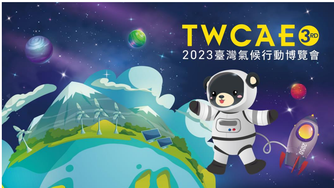
圖、博覽會主視覺示意圖

公部門行動館、企業行動館、學研公民行動館、氣候對話交流場域、大會服務台/報到處、大會活動主舞台會場