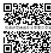
報名 QR code

六、報名方式：本次活動採網路報名( https://forms.gle/JZgjBLiB6P93Nu8s7 )，自即日起至 112 年 11 月 24 日止；因場地空間有限，參與人數以 100 人為限。